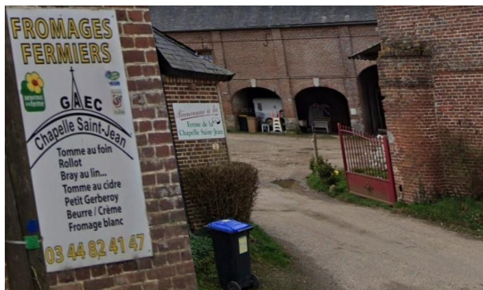
2 Rue Alexis Maillat Choqueuse, 60380 Grémévillers

Ensuite nous nous sommes rendus à la fromagerie de GREMEVILLIERS située à mi-chemin entre Songeons et Marseille en Beauvaisis.