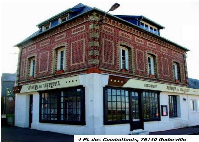
1 Pl. des Combattants, 76110 Goderville