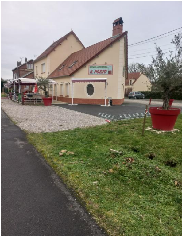
Restaurant IL POZZO - 11, rue de la Gare 60650 LA CHAPELLE AUX POTS.