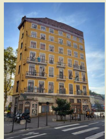
fresque des Lyonnais