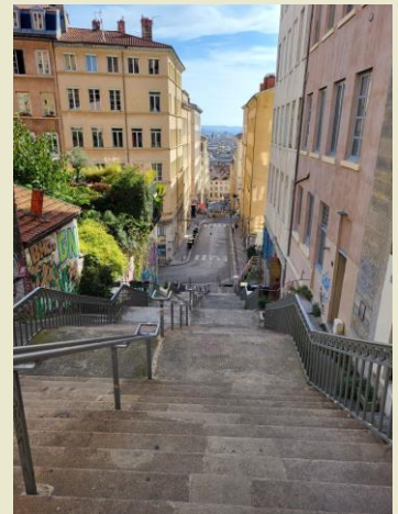
montée de la grande côte