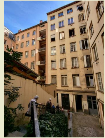
Traboule cour des Voraces

Une visite qui a été organisée au dernier moment, mais bien appréciée.