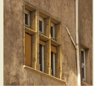
Fenêtres à meneau

Nous entamons la descente de la colline en utilisant les ruelles en pente et les traboules de la soie, ce parcours situé à l'Est de la colline surplombe le Rhône .Un symbole Traboule de Lyon balise l'itinéraire.