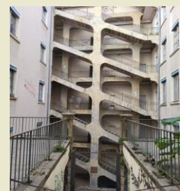
Cour des Voraces