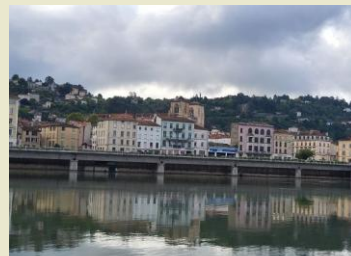
Vienne en haut notre dame de Pipet

Philippe le Bel donne l'ordre d'arrestation des templiers, le 14 septembre 1307, les principales accusations portées contre les Templiers : reniement du Christ, crachats sur la croix, baisers obscènes, pratique de la sodomie, culte des idoles n'étaient que des ragots. Environ 1500 templiers sont arrêtés dans le royaume de France le vendredi 13 octobre 1307 et