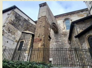
Abbaye de Saint ANDRE