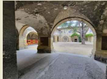
Couvent des Cordeliers