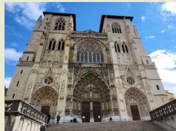
Cathédrale Saint Maurice