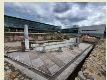
Musée de Saint Romain-en-Gal