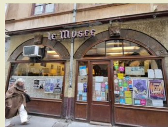
Bouchon du musée

Au 15ème siècle les milieux intellectuels s'enthousiasment pour la littérature. Cette nouvelle invention suscite toutefois un mélange de