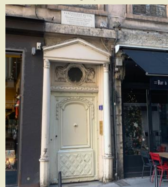
Maison de barthélemy Buyer