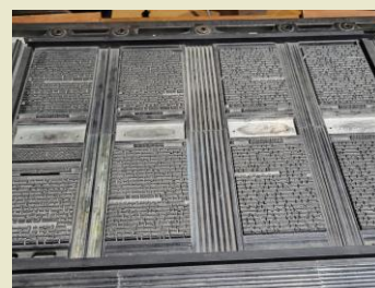
Assemblage de galées pour impression