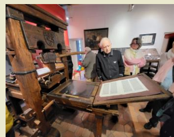
Presse à la renaissance