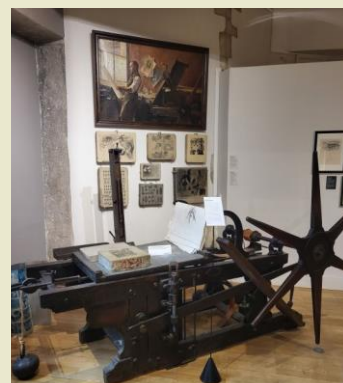
La bête à cornes pour imprimer une lithographie