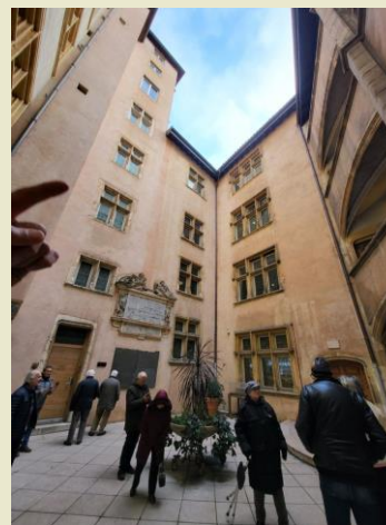
L'Hôtel de la Couronne