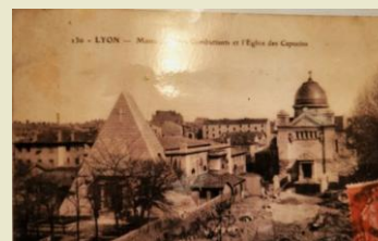
ancien tombeau de forme pyramidale et nouvelle chapelle