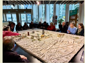
Discussion autour du projet

Nos politiques sauront-ils conserver une cohérence dans l'aménagement des quartiers ?