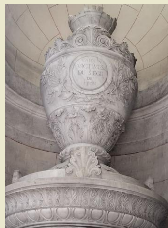
Hommage aux victimes