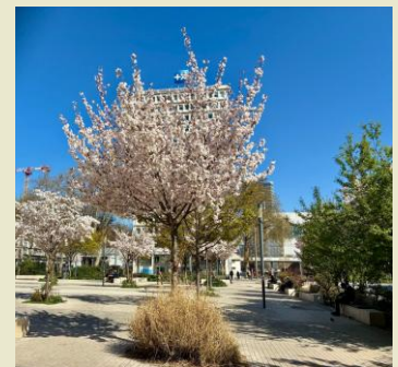
Zone végétalisée en se rendant à la maison du projet