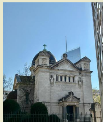
Chapelle de Sainte Croix

C'est en 1795, après la mort de Robespierre, que les familles des personnes exécutées durant ce siège meurtrier de Lyon font construire un premier tombeau en leur mémoire plaine des Brotteaux, lieu du massacre que les jacobins incendient en 1796 .En 1819 une chapelle expiatoire en forme de pyramide entourée de jardins est construite .Ce monument accueille, dans un caveau, tous les ossements des victimes des massacres de Lyon de 1793 et 1794 (alors dispersés dans de nombreuses fosses communes). Le tombeau du général de Précý, qui avait pu s'échapper de