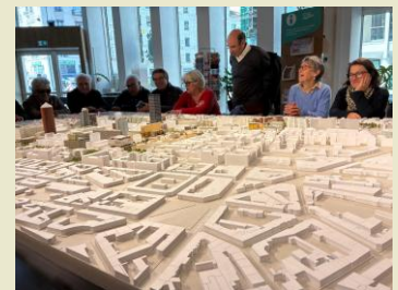
maquette du quartier de la Part-Dieu