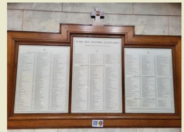
Nom des victimes