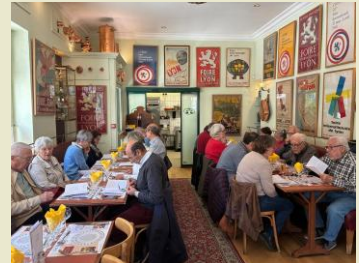
Repas au bistrot du Palais