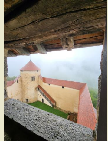
Escalier de chêne Donjon