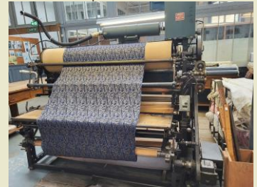
Machine métreuse plieuse