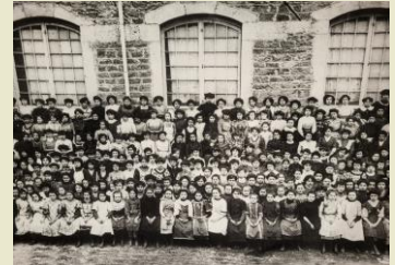
Usine pensionnat Bonnet

Ces ateliers, ces machines composent la richesse de ce fonds unique conservé dans les bâtiments d'origine.