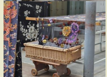
Peinture à la main