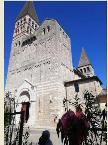
ABBAYE ST PHILIBERT