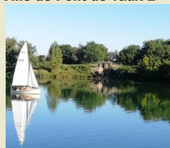
vannage sur berges