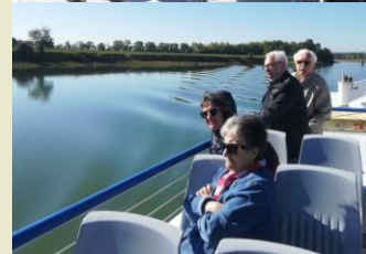
Terrain JUNOT au loin sur la prairie