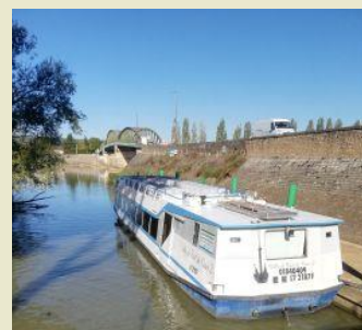
Ville de Pont-de-vaux 2