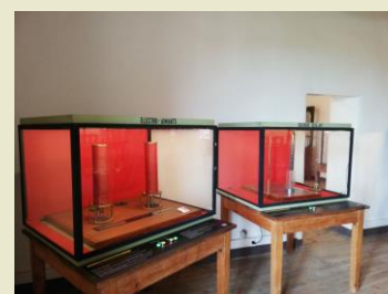
Découverte de l'électro-aimant