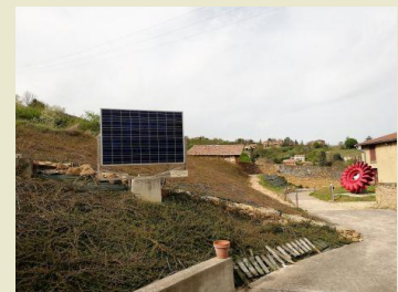
Solaire & hydro

Eolienne activée grâce à une manivelle de vélo, développer ne serait-ce que 10W nécessite un certain effort !!