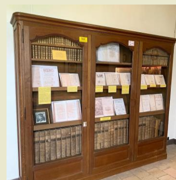
Bibliothèque de JJ Ampère