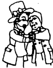
Amicale des Anciens d'ALSTOM