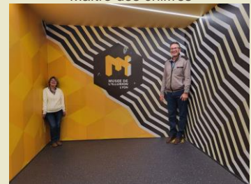
Salle d'Adelbert Ames