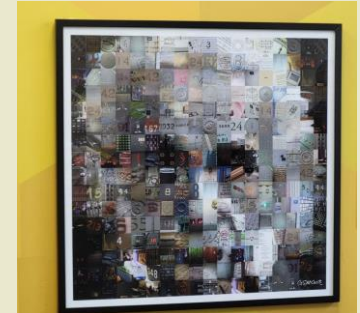
Maître des chiffres