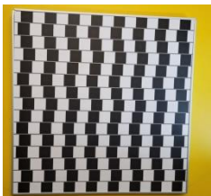
Mur de café A gauche

Les panneaux se succèdent, illusions photographiées, le Kaléidoscope où les motifs joyeux sont créés par le visiteur, l'illusion du mur de café : composée de lignes de 'briques' noires et blanches en alternance qui sont séparées par une ligne de mortier gris qui paraissent courbées alors que les lignes sont droites et parfaitement parallèles et horizontales, vous aurez l'explication de ces phénomènes en vous rendant sur place et en lisant les explication