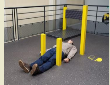
Chaise de BEUCHET